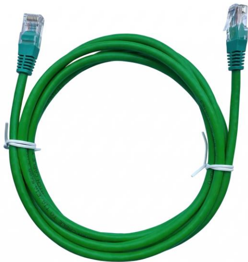
RJ45 CAT5E UTP Patch Cable