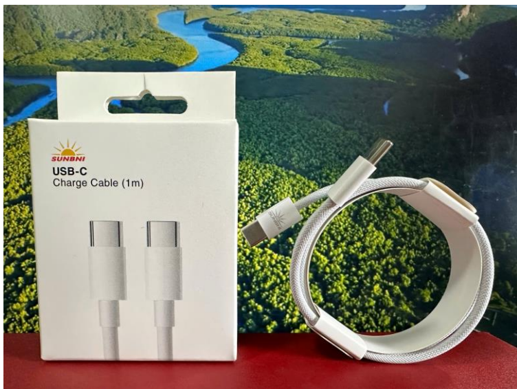
USB-C Charge Cable