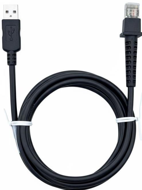
USB-A to 10P10C (RJ50) 2M