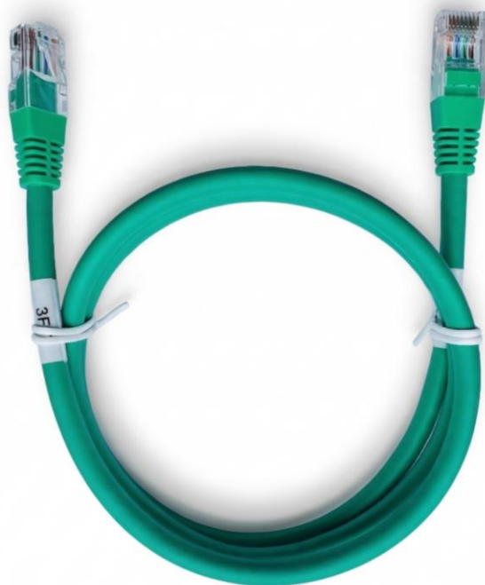
CAT.6 UTP RJ45 3FT