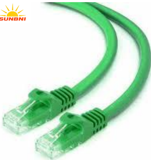
CAT.6 SFTP RJ45 1M