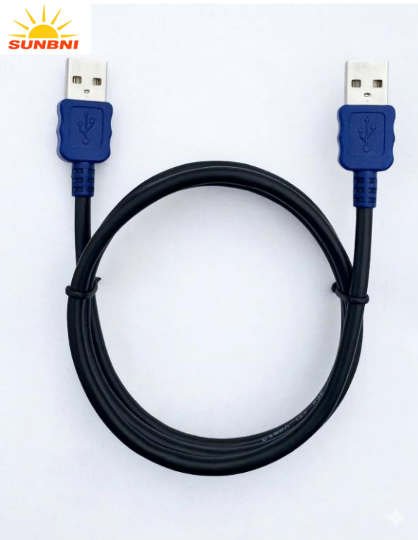
USB 2.0 A/M to A/M 1M