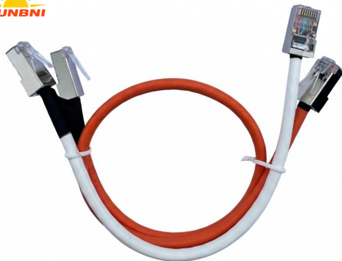
RJ45 Bundle Cable