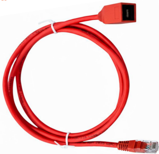
RJ45 Plug to Jack 1.5M