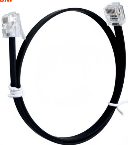
Flat CAT6 Ethernet Cable