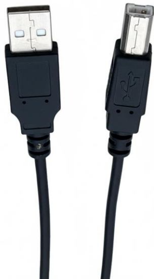
USB 2.0 A to B 3M